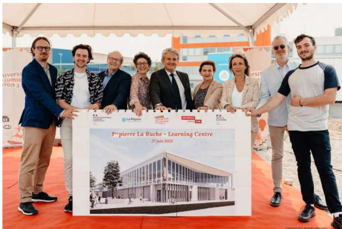
Pose de la première pierre de La Ruche le 27 juin 2023 / Crédits photo © Florine Jeannot - Université Lumière Lyon 2

Pendant la période de travaux, l'université accompagne et informe ses étudiant.es. Des solutions concrètes sont proposées pour faciliter l'accès au campus et permettre ainsi de se rendre sereinement sur son lieu d'études ou de travail.