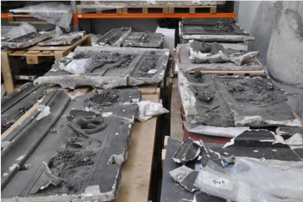
Moulage de la Porte du Paradis de Lorenzo Ghiberti

L'Université Lumière Lyon 2 se lance dans l'aventure du mécénat avec une première opération au sein de son Musée des Moulages en partenariat avec la Fondation du patrimoine. L'ambition de cette initiative inédite ? Restaurer le moulage de La Porte du Paradis , une œuvre de l'artiste Lorenzo Ghiberti qui orne le baptistère de Florence en Italie. S'élevant sur plus de 5 mètres, cette œuvre monumentale est considérée comme l'un des fleurons de la Renaissance italienne.